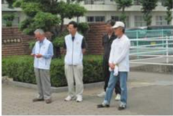
嬉野ロータリークラブ