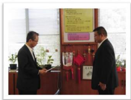
【学校への指定書交付】