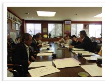
【運営協議会のようす】