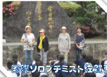
国際ソフテニスト佐賀西部