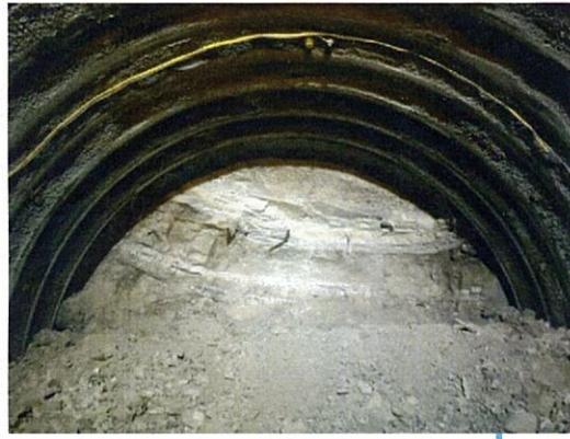
本坑掘削(切羽(きりば)は)状況