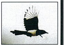
佐賀県鳥 (カササギ)