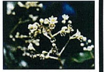
佐賀県花 (クスの花)