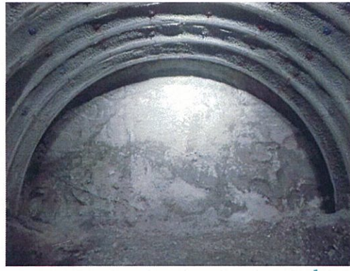
本坑掘削(切羽(きりば)は)状況