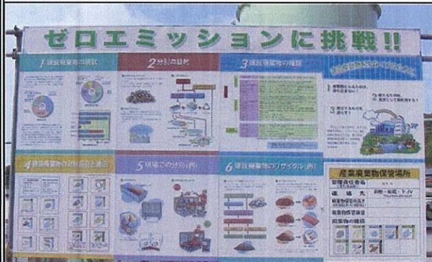
⑤産業廃棄物の分別看板

トンネルまめ知識 〇お茶漬け、ねこまんま〇 坑夫さんは「茶漬け」「ねこまんま」を食べないと聞いたことはありませんか？ 茶や汁をかけたときにご飯が崩れる様が、トンネル掘削面の崩落を想像させ、縁起が悪いとして避けているそうです。 実際、ご作業所の坑夫さんは食べないそうです。 涼しい仕事日和はあっという間に過ぎ去り、寒い時期になりました。寒さに負けず、身を締め、正月休みまで頑張るぞ！ (編集:JV武内)