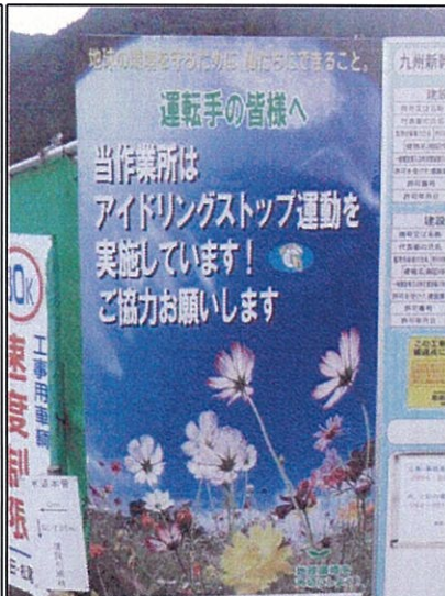
③アイドリングストップ注意喚起