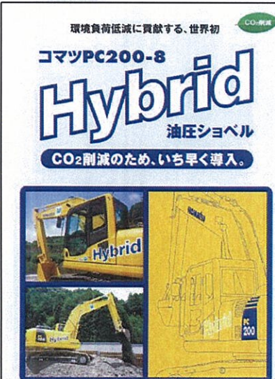
④ハイブリッド油圧ショベル