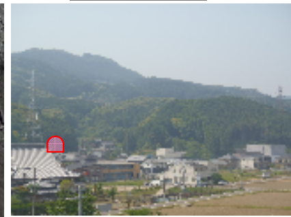
始点側坑口(武雄方)