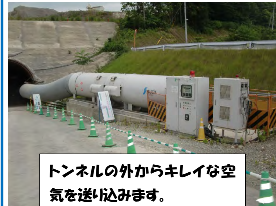
トンネルの外からキレイな空気を送り込みます。