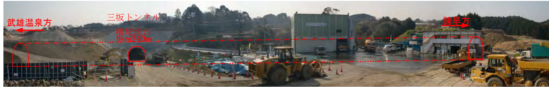
仮設工事作業状況