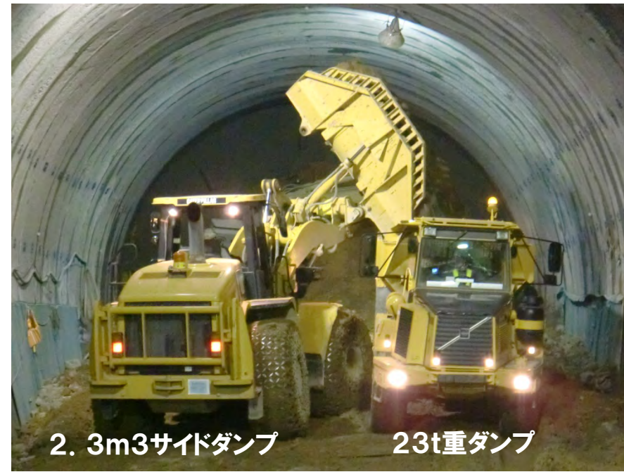
2. 3m3サイドダンプ 23t重ダンプ