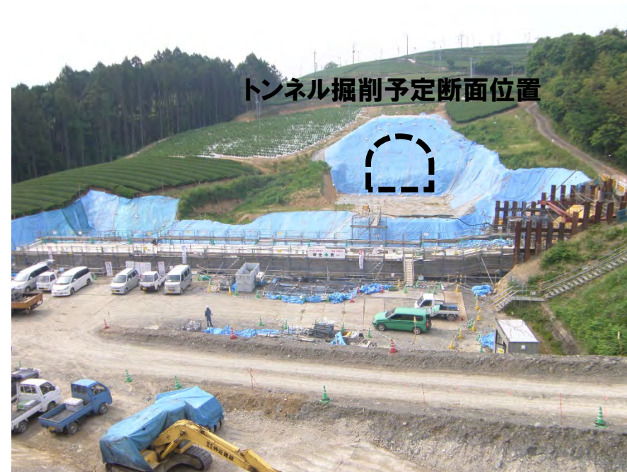
トンネル掘削予定断面位置