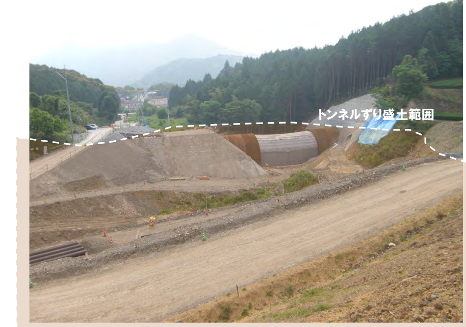
トンネルずり盛土範囲