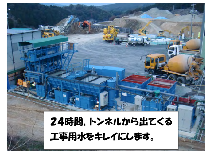
24時間、トンネルから出てくる工事用水をキレイにします。