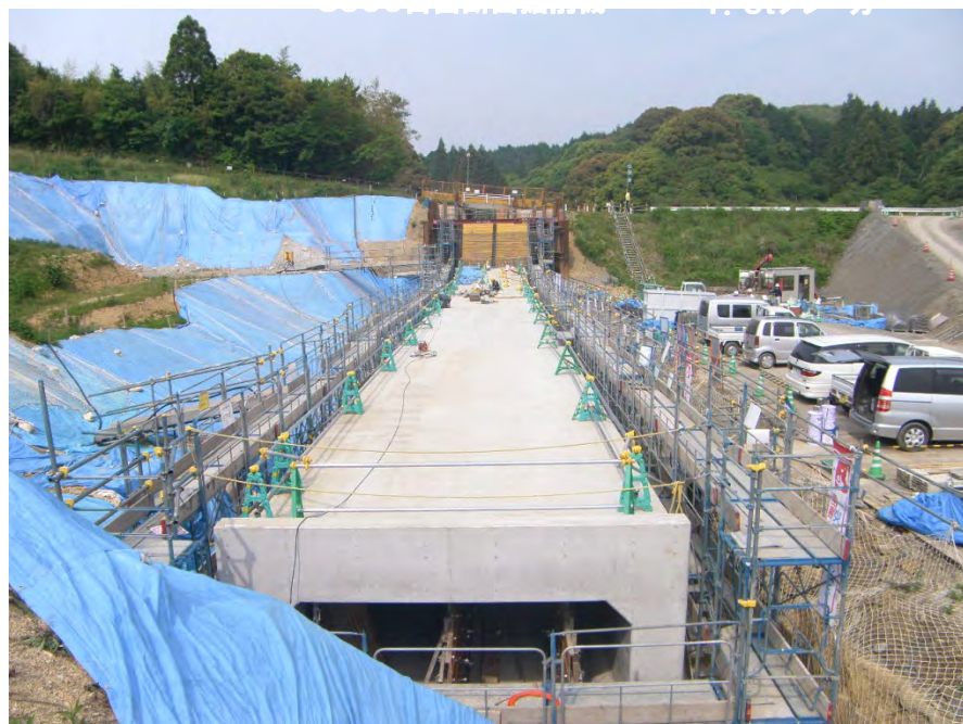
長尾ため池水路付替え仮設備作業状況