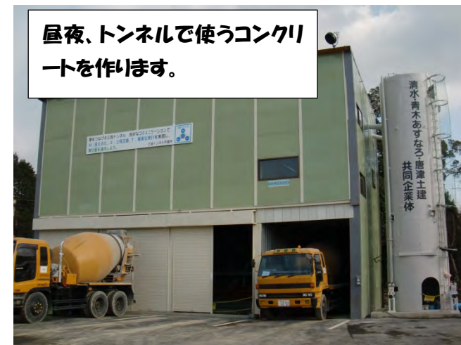
コンクリートプラント