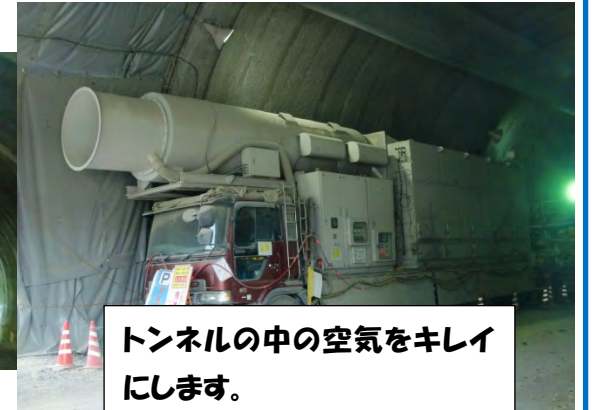
トンネルの中の空気をキレイにします。