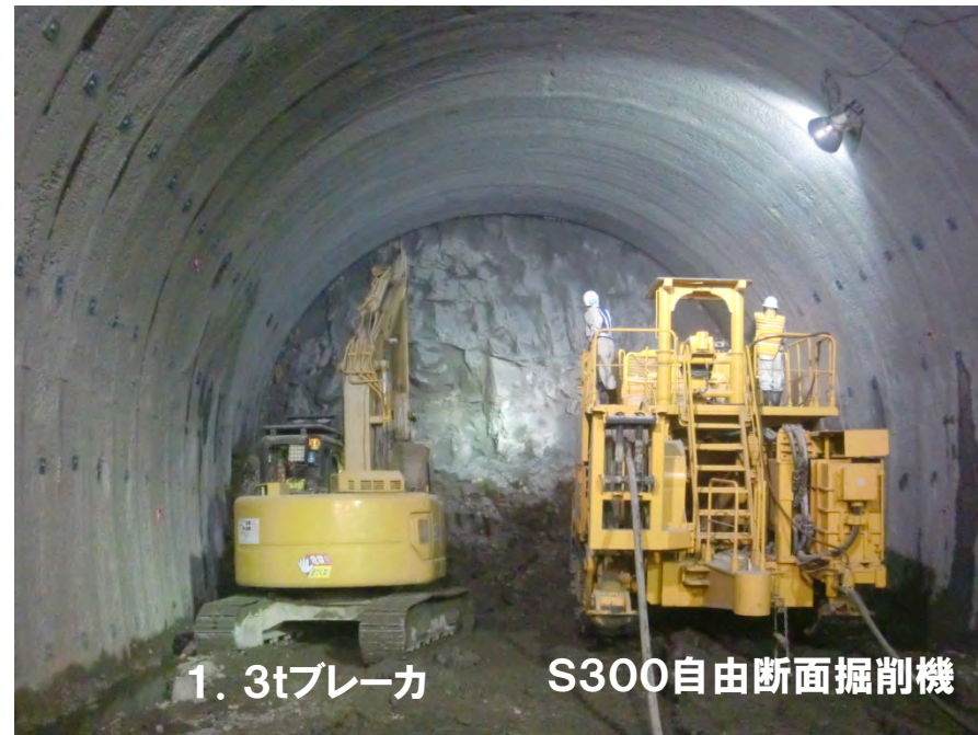
1. 3tブレーカ S300自由断面掘削機