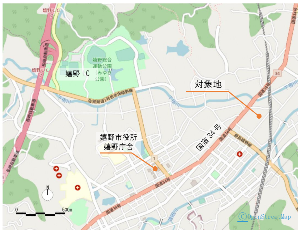
図 1 対象地位置図