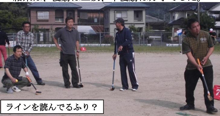
ラインを読んでるふり？