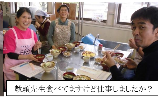
教頭先生食べてますけど仕事しましたか？