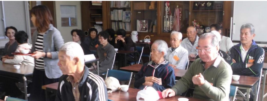
お孫さん達と遊んでくださったおじいちゃんおばあちゃん達本当にありがとうございました。子供達もそうですけど、皆様方は日本国の宝です。いつまでもお元気でいてください。

今年も1、2年生がおじいちゃん、おばあちゃん達と一緒に「昔遊び体験」をしました。特に今年は、嬉野市教育の日と一緒に今まで以上に凄く有意義な一日でした。子供達、お父さん、お母さん、そしておじいちゃん、おばあちゃん達、すばらしい笑顔でした。皆さん本当にありがとうございました。来年もまたお願いします。