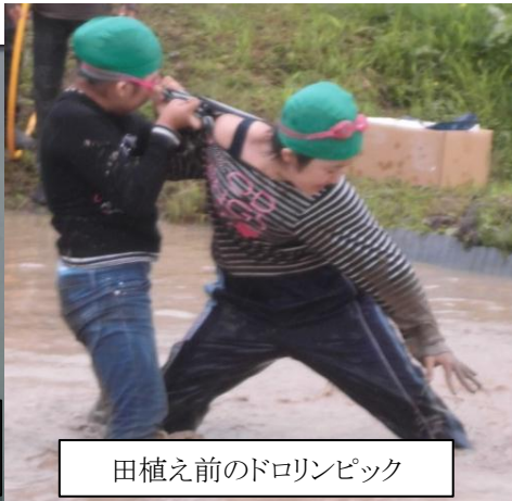
田植え前のドロリンピック