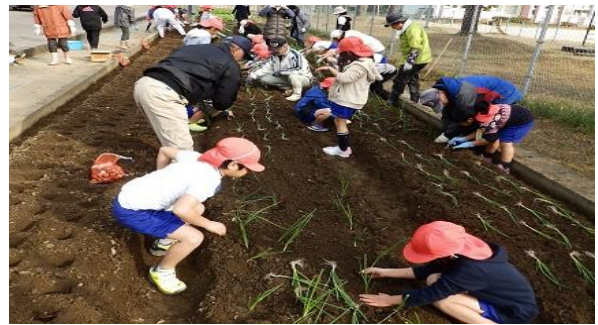
◎ 玉葱700本 チューリップ360球