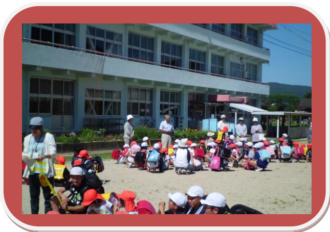
▼コミュニティ会長の挨拶