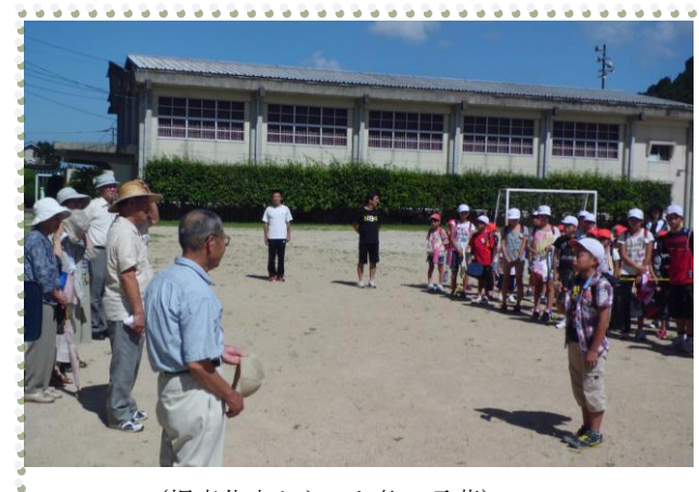
(児童代表からのお礼の言葉)

★「地域見守り隊」の方は、ほぼ毎日の出動。「青パト隊員」は毎週水曜日の出動。大変ご苦勞様です。子供達の安全・安心のため、これからもずーっと続けて頂くようお願いいたします。