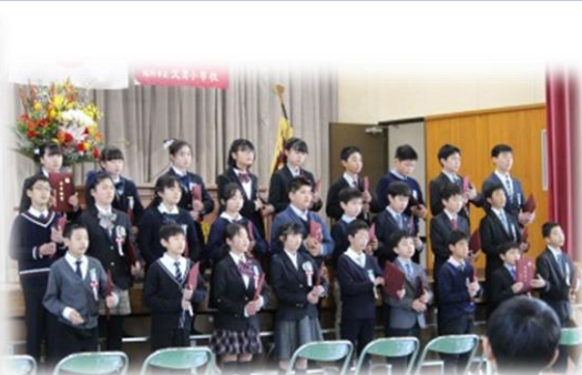
卒業証書を胸に・・・なに想う！