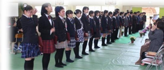
保護者に6年間の感謝を！

3月15日(金)久間小学校卒業証書授与式に出席しました。27名の生徒達が学び舎を後にしました。卒業生の涙を見るとつい涙が・・・6年間の思い出が走馬灯のように駆け巡りました。中学校でも「がんばるんじゃー」を肝にめいじ健康に注意し頑張ってください。