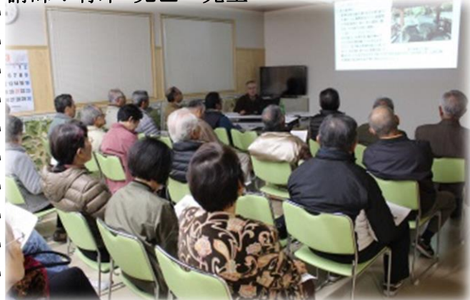
多くの資料をプロジェクターで紹介

3月14日(木)久間地区コミュニティセンターで「歴史講座」を開催しました。(参加者26名)。講話の内容は市内の観光名所を①温泉②塩田津③不動山の切丹④長崎街道⑤お茶⑥窯業の項目に分け、その歴史を中心にまとめたものです。8名のプロジェクトチームによって企画され冊子化される予定のもので、それに先駆けて久間の歴史講座で披露して頂きました。非常に貴重なお話で、初めてお聞きした内容もありました。一つ一つの歴史があり何かわくわく致しました。嬉野・塩田の新たな歴史をひもといて勉強し、郷土愛を育んでもらえば幸いです。