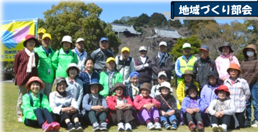
吉浦神社をバックに、疲れも見せず“ハイ！チーズ”