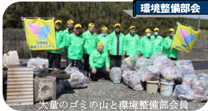
大量のゴミの山と環境整備部会員

3月16日(土)防火林道杵島山線〜桜谷林道の環境パトロールを実施(12名参加)。杵島山線の、のり面にはテレビ・電気炊飯器・ゴルフバッグ・こたつ・デスクトップ・ガステーブル等電気製品が目立った。大型冷蔵庫は滑落の危険ありと判断、市へ依頼したい。桜谷線も沢山のゴミが散乱。谷底みたいなところの回収は出来ないのもこれもあり、回収したい。今回軽トラ4台分あり、回収したゴミはビツクリの25袋。久間から不法投棄を無くすため、皆さんの知恵とご協力をお願い致します。