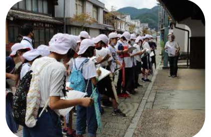
塩田津散策説明に聞き入る