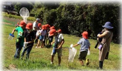
昆虫採集に頑張る2年生

9月29日(火)楽しみにしている2年生の期待にこたえようと、前日先生とザリガニ釣りを準備しました。はじめてザリガニにさわる子もいて、おそろおそろつかんでいました。コオロギなどもつかまえて、にぎやかに大きな楽しい声がひびいていました。