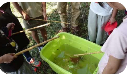
ザリガニ釣れたかな?