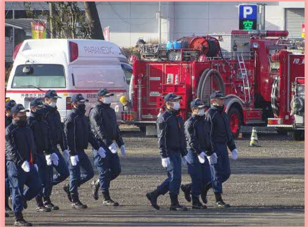
1月13日中央広場で訓練されていました。

「規律ある行進訓練を実施しました。今年も、安全・安心なまちづくりを目指し、職員一同足並みそろえて頑張っています！」