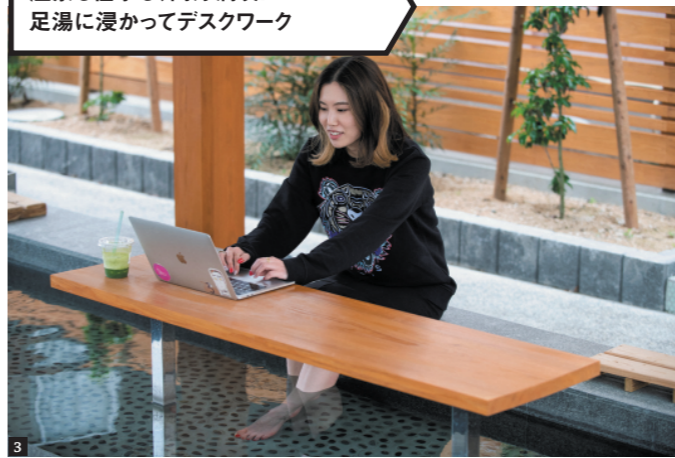
1) 足蒸し湯。蒸気が逃げないように箱と足の間をタオルで塞ぐと、より効果的。2) 「湯つつら広場」には、足湯、手湯、子ども用の遊び湯がある。タオルはないので持参しよう。3) 嬉野茶を片手に足湯でデスクワークができる