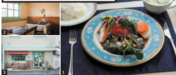
1) 丁寧に仕込んだデミソースがかかるハンバーグステーキセット（820円）。2) 柳川時代の常連も通う。3) 店は湯宿広場の目の前にある

福岡県柳川市で29年愛された洋食店の店主がUターン。肉汁をしつかり閉じ込めたハンバーグなど、どの料理も絶品。おすすめは黒毛和牛のランプ肉を使うステーキやビーフカツレツ。