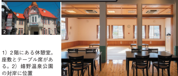
1) 2階にある休憩室。座敷とテーブル席がある。2) 嬉野温泉公園の対岸に位置

ゴシック風建築が象徴的な公衆浴場。大浴場、貸切湯のほか、採光のよい広々とした休憩室があり、仕事の合間に温泉を楽しめる。出前が頼めるので、丸一日“お籠り”してもいい。