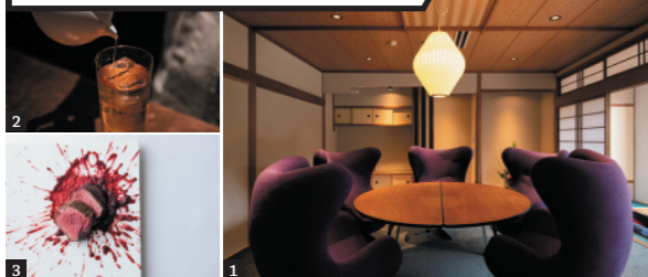
1) 会員専用オフィス「VOGUE」。2) 「茶寮&BAR」では茶酒が味わえる。3) 「李荘庵」では有田焼のうつわで佐賀の美味を満喫できる

会員専用コワーキングスペースを利用し、滞在中はコンシェルジュがサポート。仕事しながら、茶や温泉も満喫できる。働くには申し分ない、温泉旅館での新しい働き方がスタートした。