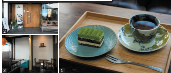
1) 緑茶シロップを用いたほうじ茶生地のティラミス・茶畑（396円）と嬉野ほうじ茶（330円）。2) 店構えもかわいい。3) テーブル席がメイン

温泉街にあるパティスリー & カフェ。ドリンクをはじめ、スイーツにも嬉野の茶を多用するなど、ご当地ならではの味わいを満喫できる。呉服店の中にある、落ち着いた雰囲気もいい。