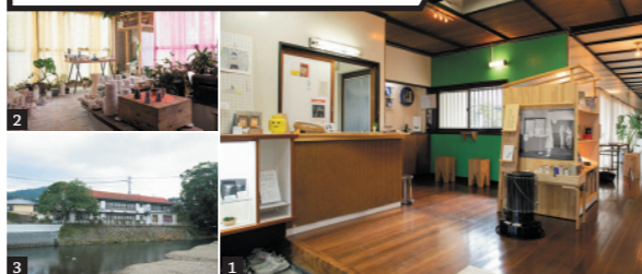
1) ハンドドリップコーヒー店「おひるね諸島」が同施設の顔。2) うつわ作家のアトリエ。3) 建物は船会社の保養所だった

場所は老舗旅館・大村屋の対岸。コーヒースタンド「おひるね諸島」をはじめアトリエ、イベントスペースを併設。「bihada Wi-Fi」エリア外なのでWi-Fiが必要な場合はスタッフに確認を。