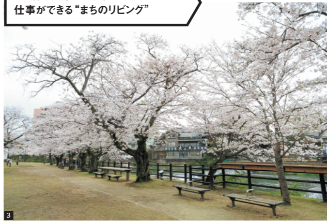
1) 川岸は広く、腰を掛けられる場所も多いため、ゆったりと利用できる。2) 塩田川を望む絶好のロケーションでデスクワークできる。3) 地元民や観光客の憩いの場。対岸に位置する「新湯広場」にもテーブル席や電源がある。