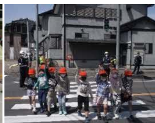
1年生 交通安全教室