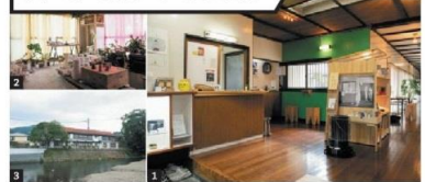
1) ハンドドリップコーヒー店「おひるね諸島」が同施設の隣。2) うつわ作家のアトリエ。3) 建物は船会社の保養所だった

場所は老舗旅館・大村屋の対岸。コーヒースタンド「おひるね諸島」をはじめアトリエ、イベントスペースを併設。「bihada Wi-Fi」エリア外なのでWi-Fiが必要な場合はスタッフに確認を。