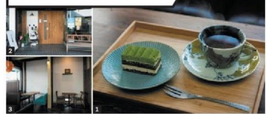
1) 緑茶シロップを用いたほうじ茶生地のティラミス・茶畑（396円）と嬉野ほうじ茶（330円）。2) 店構えもかわいい。3) テーブル席がメイン 温泉街にあるパティスリー&カフェ。ドリンクをはじめ、スイーツにも嬉野の茶を多用するなど、ご当地ならではの味わいを満喫できる。呉服店の中にある、落ち着いた雰囲気もいい。