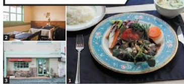
1) 丁寧に仕込んだデミソースがかかるハンバーグステーキセット（820円）。2) 柳川時代の常連も通う。3) 店は湯宿広場の目の前にある

福岡県柳川市で29年愛された洋食店の店主がUターン。肉汁をしっかりと閉じ込めたハンバーグなど、どの料理も絶品。おすすめは黒毛和牛のランプ肉を使うステーキやビーフカツレツ。