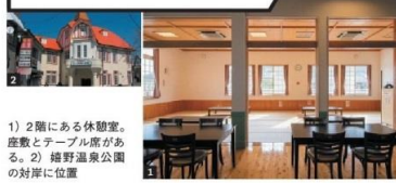
1) 2階にある休憩室。座敷とテーブル席がある。2) 嬉野温泉公園の対岸に位置

ゴシック風建築が象徴的な公衆浴場。大浴場、貸切湯のほか、採光のよい広々とした休憩室があり、仕事の合間に温泉を楽しむ。出前が頼めるので、丸一日「お籠り」してもいい。