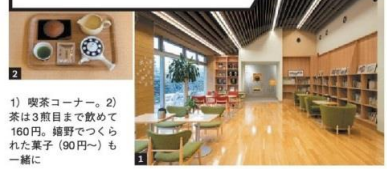
1) 喫茶コーナー。2) 茶は3煎目まで飲めて160円。嬉野でつくられた菓子（90円～）も一緒に

うれしの茶の歴史や製造工程等を学べる公共施設。喫茶コーナーではデスクワークが可能で、施設独自のフリーWi-Fiがあるほか電源も借りられるため、ワーケーションに最適だ。