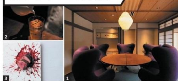
1) 会員専用オフィス「VOGUE」。2) 「茶寮&BAR」では茶酒が味わえる。3) 「李荘庵」では有田焼のうつわで佐賀の美味を満喫できる

会員専用ワークスペースを利用し、滞在中はコンシェルジュがサポート。仕事しながら、茶や温泉も満喫できる。働くには申し分ない、温泉旅館での新しい働き方がスタートした。