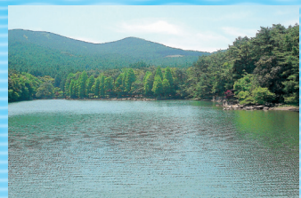
●湖水…森と湖が四季折々の表情を見せてくれます。