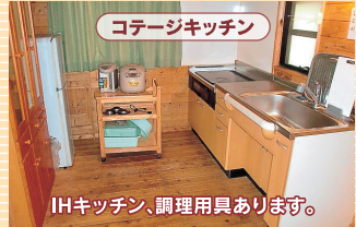
コテージキッチン