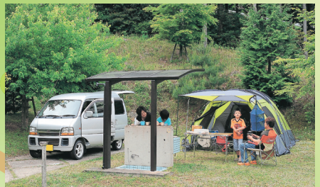
●オートキャンプサイト…芝生敷きで100㎡のゆとりあるスペース。電源付き流し台も完備しています。