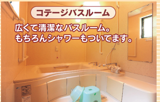
コテージバスルーム