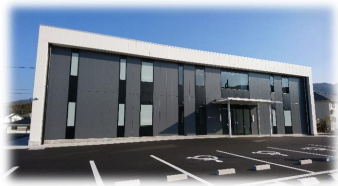
嬉野オフィスビル外観