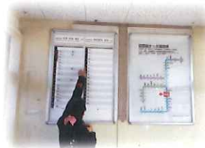
外出トレーニング 時刻表の見方などを学びます。