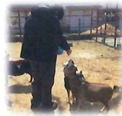
牧場でのエサやり体験