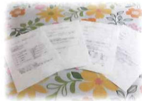
対人スキルトレーニング