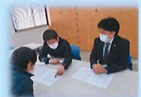
履歴書作成・面接の練習