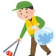
ボランティア活動