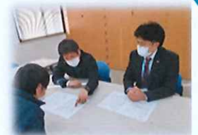
履歴書作成・面接の練習