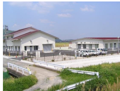
五町田・谷所地区処理場