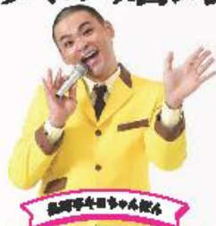
長崎亭キヨちゃんぼん