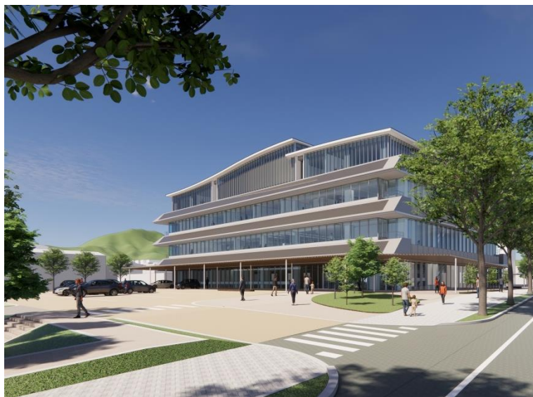
(新庁舎外観パース)

嬉野市新庁舎建設基本計画を踏まえ、基本・実施設計を進めています。 併せて、建設予定地となっている嬉野庁舎第2庁舎の解体を進めます。 塩田庁舎等利活用では、その理念・方針等を定めた基本構想を策定しました。