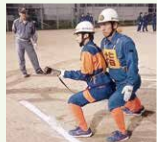
▲ 訓練の様子(指揮者・1番員)