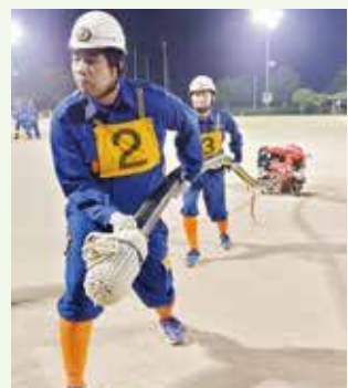
▲ 訓練の様子(2番員・3番員)