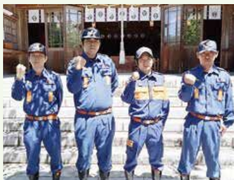
▲ 祈願祭の様子(選手)