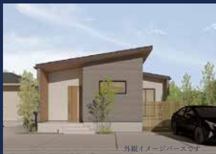
外観イメージバースです