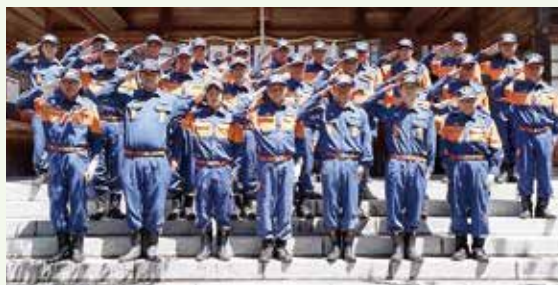
▲ 祈願祭の様子(全体)