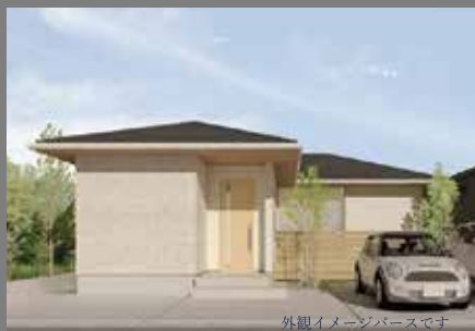
外観イメージパースです