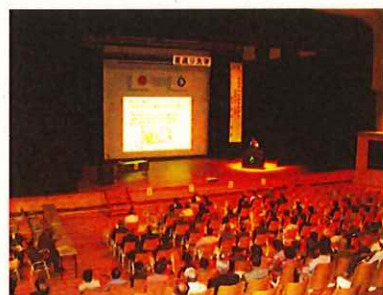
「若返り大学」(於：リパティ)