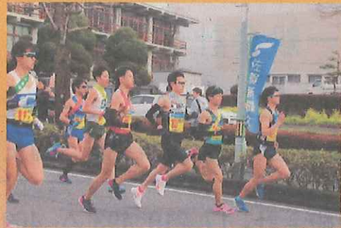
2日目の嬉野庁舎前スタート で一斉に駆け出す選手たち