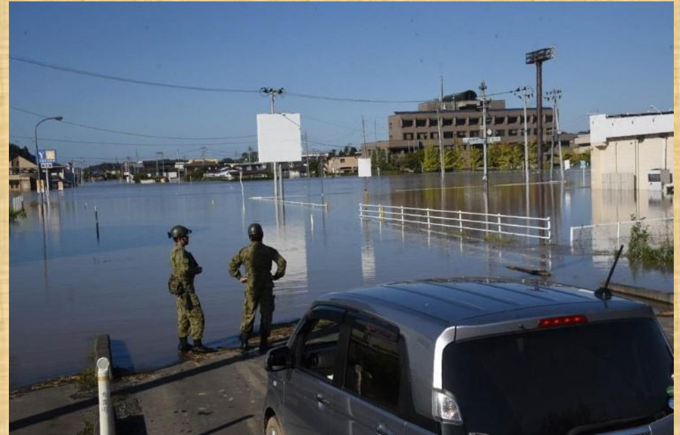
2019年 台風19号 宮城県丸森町