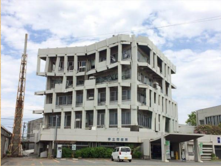
2016年 熊本地震 宇土市