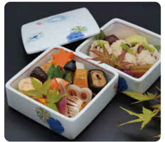
旅館 大正屋 御膳