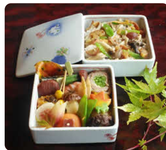
創作懐石 花の 御膳