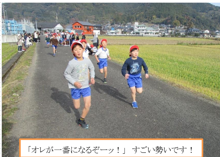
「オレが一番になるぞーっ！」すごい勢いです！

スッキリと晴れ渡った青空になりました。11月下旬から始まったマラソンタイムの練習の成果を発揮する日がやってきました。子ども達が少しずつスタート地点に集まってきました。最初は、3年生の女子からスタートしていきました。しばらくして、男子がスタートしましたが、とても長距離走の走り方ではなく、脱兎のご