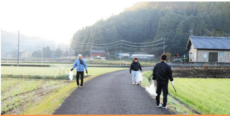
朝の冷えた空気が感じています。お疲れ様です！

私事ながら、珍しくおなかを壊し、背中もバリバリに凝っていて、30日は1歩も外に出られずに、「日曜日は大丈夫かな?」、と不安に思っていたら、朝になったら背中中のバリバリは消えていましたが、お腹は……。