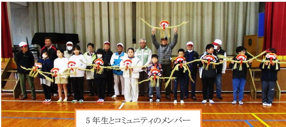
5年生とコミュニティのメンバー

今年は、4年生の親子行事にさせていただきました。例年、5年生の行事でしたので、今の5年生が体験できなくなるといって、今年だけ2学年一緒に行いました。しめ縄つくりにも協力してもらっているコミュニティのメンバーも、高齢化で次第に少なくなりつつありま