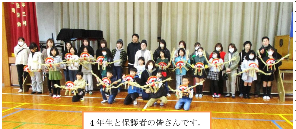
4年生と保護者の皆さんです。

今年は、4年生の親子行事にさせていただきました。例年、5年生の行事でしたので、今の5年生が体験できなくなるといって、今年だけ2学年一緒に行いました。しめ縄つくりにも協力してもらっているコミュニティのメンバーも、高齢化で次第に少なくなりつつありま