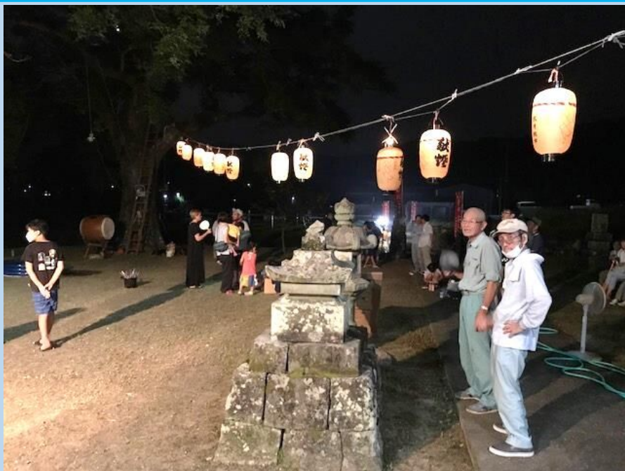
かわかみたんじょう

8/16(金)俵坂区公民館とお堂が開放され、明かりが灯されました。「イベントは何にもしないよ」と言われていても公民館のこの縁側を見に行かないと落ち着かない灯籠祭です。お堂も公民館も住民の手によって大事に手入れされ、毎月、国道の空き缶拾いもされています。