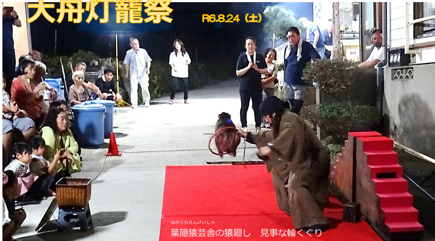
はがくれえんげいしゃ 葉隠猿芸舎の猿廻し 見事な輪くぐり