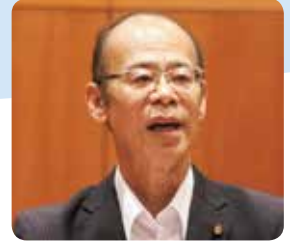
梶原 睦也 議員