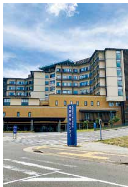
▲ 安心した小児救急医療体制の構築を

うし、また、市民の方からも不安な声をたくさん聞く。今までは嬉野医療センターが時間外小児救急診療の大きな役割を担っていたが、佐賀県の保健医療計画において嬉野医療センターの位置づけは、