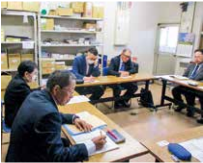
▲源泉保護について考える

護に関するルールの策定が必要である。温泉の諸問題については、源泉所有者と配湯を受ける側で協議を行い、温泉利用目的や揚湯量に関する条件等を協議・策定されることが望まれる。また、源泉集中管理も視野に入れ、今後は広く議論していくべきではないかと考える。 また、入湯税は目的税であり源泉集中管理関連事業への充当等についても検討する必要がある。 最後に、温泉資源を守ることが第一条件であり、源泉所有者配湯を受ける事業者、市民等を含めた情報共有の会を作り、条例制定に向けた体制づくりの強化が急務である。