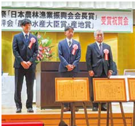
▲ 品評会で表彰を受ける生産者

ポンプ交換時費用は事業者負担である。 山口 嬉野市の温泉資源保護のため、集中管理は必要と考える。温泉湧出量の調査を再度県と調査され、配当を受ける事業者や個人、学者を交えた協議会が必要と考えるが、 観光商工課長 新たな情報共有の場を設定していく。