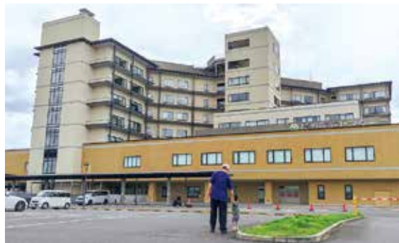
▲ 24時間体制の復活を望む

有田と同等の技術を持っていた肥前吉田焼の、文化財としての価値や情報を発信するべきではないか。 教育長 価値あるものと思っている。現在、市史編さんを進めていて、その中にも記載しており、発行できる時期に何らかの形で発信したい。 常設展等は首長部局と相談し、検討したい。