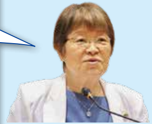
阿部 愛子 議員