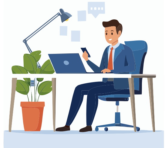
▲ 更なる業務の効率化を図れ

答 移動可能な内線電話として利用できるほか、出先での連絡ツールとしても活用できる。また、スマホアプリを利用できるようになるため、例えば公用車予約アプリ、職員間で利用するチャットアプリなど、様々なアプリの活用による働き方改革の効果も期待できる。