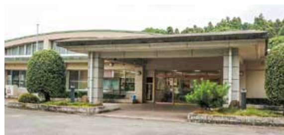
▲ 高齢単身世帯の対策を