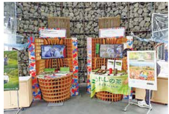
▲ 中山間地域の魅力を世界へ

答 中山間地域で引き継がれる「うれしの釜炒り茶」や新たなチャレンジで取り組むビーツ栽培を映像で紹介する。中山間地農業を支援し、ネットワークを広げていく事業であるため、お茶の販売等はできない。