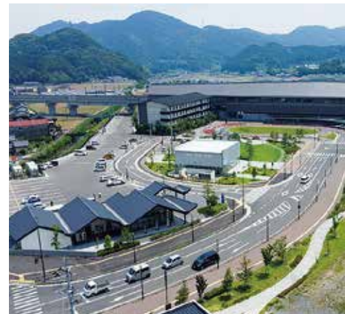
▲ 災害時の拠点となる道の駅

建設課長 今年度の非出水期の10月から工事に着手する予定と聞いている。 川内 以前も県へ要望を行ったが、下流側の護岸の防災対策工事に関してはどうなったか。 建設課長 現在、県で下流の部分も行うか、検討されている。