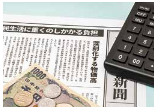
▲ 物価高騰対策は待ったなし！