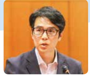
山口 卓也 議員