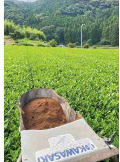
▲ 高騰しても欠かせない肥料