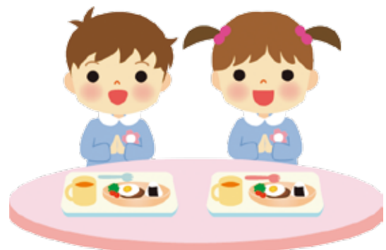
▲ おいしくお腹いっぱい！