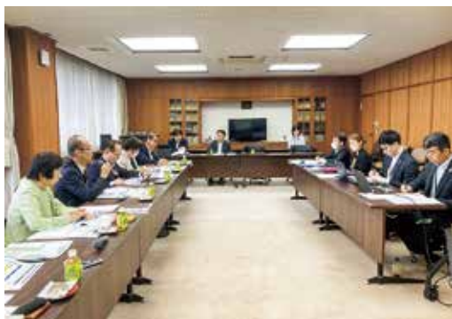
▲産官学の取組みを学ぶ

合志市の取組みは、「市民の心と体の健康、地域の健康、行財政の健康」という3つの柱に分類し取り組まれており、事業を展開する所管課においても、健康ほけん課のみで行われておらず、秘書政策課が主体的に企画展開されている。