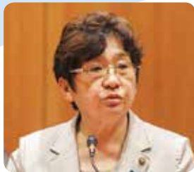
古川 英子 議員