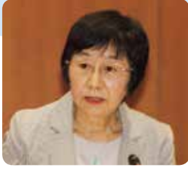
増田 朝子 議員