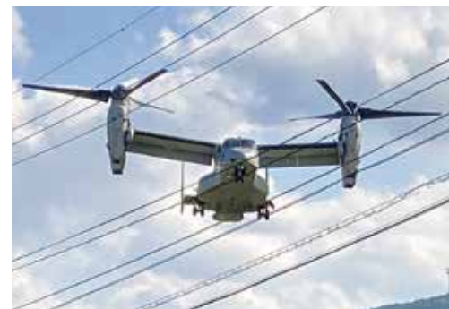
▲ 低空飛行訓練の様子

日開庁、時間外開庁している。どうしても窓口に行けない時は、代理の更新もあるのですが、市民課に相談してほしい。