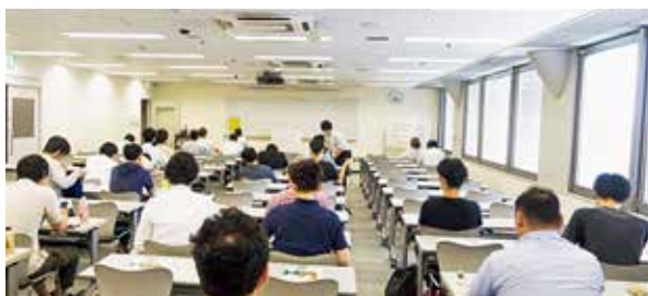
▲ 国の有機農業塾、参加しては！

芦塚 不登校児童・生徒に対する対策は。 教育長 別室登校の部屋を作り、少しの時間でも