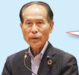
森田 明彦 議員