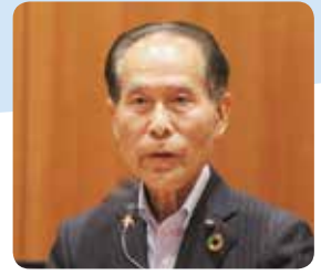
森田 明彦 議員