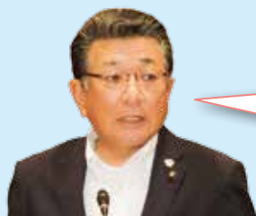
川内 聖二 議員

3月の当初予算が修正動議により減額されたため、企業は年次計画を変更せざるを得ないことになった。このことは年次協定書にも記載してある。これにより今回、集客費の委託料を予算計上されたが、それに対しても修正動議を提出された。今後委託業者に事業費の負担を負わせて事業を行えと言うのか、よって今回の修正動議に関し、強く反対の意を表す。