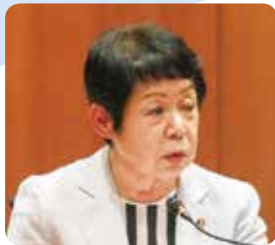
芦塚 典子 議員