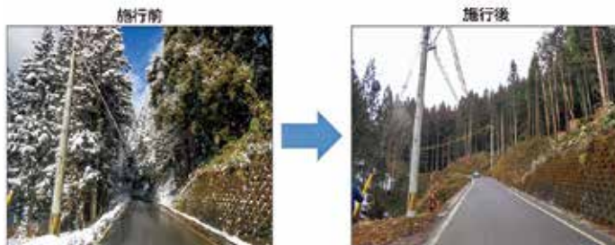
▲ 事前伐採による他県の取り組み