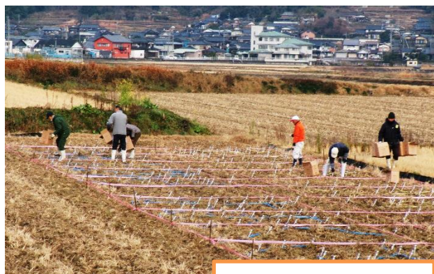
式浪区の様子です。