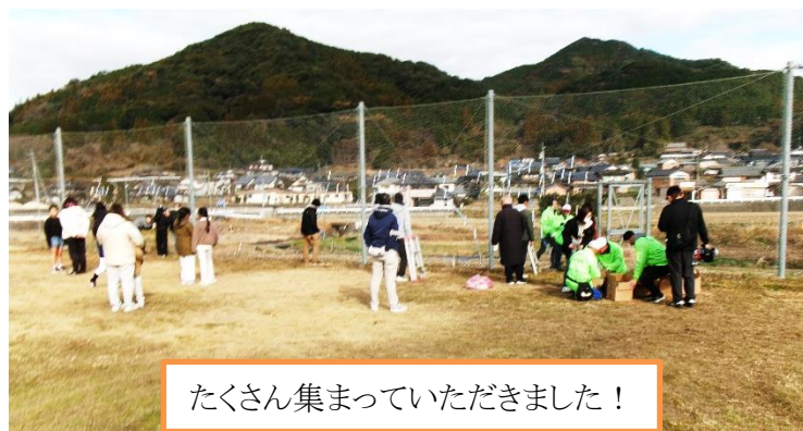
たくさん集まっていただきました！

総勢45名程度で、設置作業そのものは30分強で終了しました。小学校のライトアップは、フェンスや法面なので文字が分かりやすかったのですが、翌日行った式浪の設置は、上下2段の間隔が狭くて、夜になって見ると灯りが混雑して、なんと書いてあるか分かりませんでした。