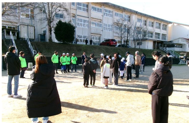
セレモニーの様子ですが、写真が下手です！

嬉野市が、合併20周年を記念して、地域や団体が自主的に行う記念行事に対して補助を行う、という周知がありました。そこで、この合併による効果が一番大きい地域だと思われる大草野校区なので、「ぜひ何かをしたい！」という思いに駆られて、手を挙げることにしました。令和7年度中の事業採択は、3件の予定でしたが、5件の応募があったということで、市の担当課のヒアリングを受けました。その結果、「採択」を得ることができました。1月1日の合併の日までにライトアップができるようにしようと、さっそく準備に取り掛かり、年末の12月27日大草野小学校、28日式浪区、29日角ノ谷区の3カ所にソーラーライトを設置しました。